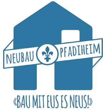
Das Logo des Projekts Pfadiheimbau.

LH - Nach dem Sponsorenlauf geht es zügig weiter. Damit der Lottomatch, der um 20 Uhr beginnt und um 2 Uhr sein Ende findet, ein unvergesslicher Abend wird, braucht es ein spielfreudiges Publikum. Die engagierten Pfader laden Sie und Ihre Familie am Samstag, 26. Oktober, in die Aula Sternmatt 2 in Baar ein. Es lohnt sich vorbeizuschauen. Gewinnen Sie tolle Preise wie Velos, eine Heissluftballonfahrt, Kaffeemaschinen, diverse Gutscheine und vieles mehr. Auch für Verpflegung ist gesorgt. Lassen Sie sich von den Service-Pfadern verwöhnen. Egal ob Sie Lotto spielen, ein gutes Essen geniessen oder sich mit Freunden und Bekannten in gemütlicher Atmosphäre treffen, am Lot-